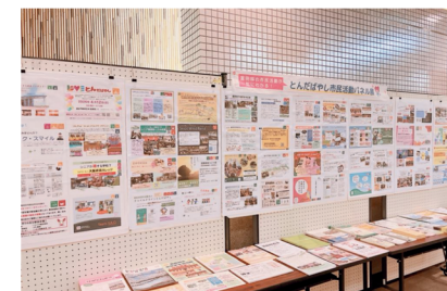
写真は昨年の様子